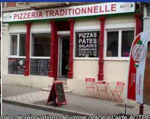
Deux exemples de rénovations de vitrine, grâce à l'aide ACTPE