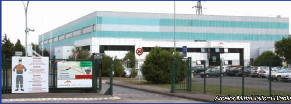
ArcelorMittal Tailored Blanks