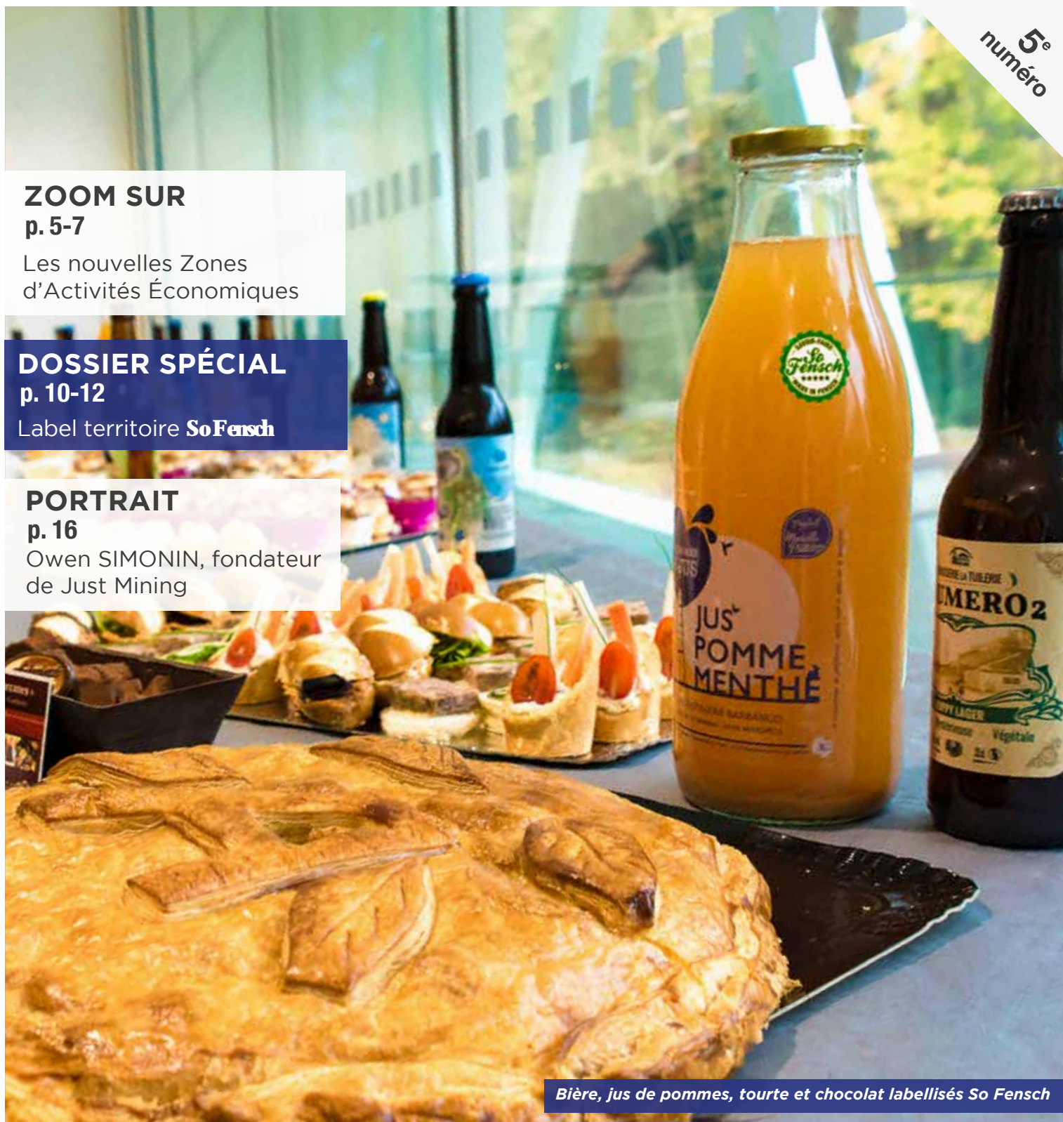
Bière, jus de pommes, tourte et chocolat labellisés So Fensch