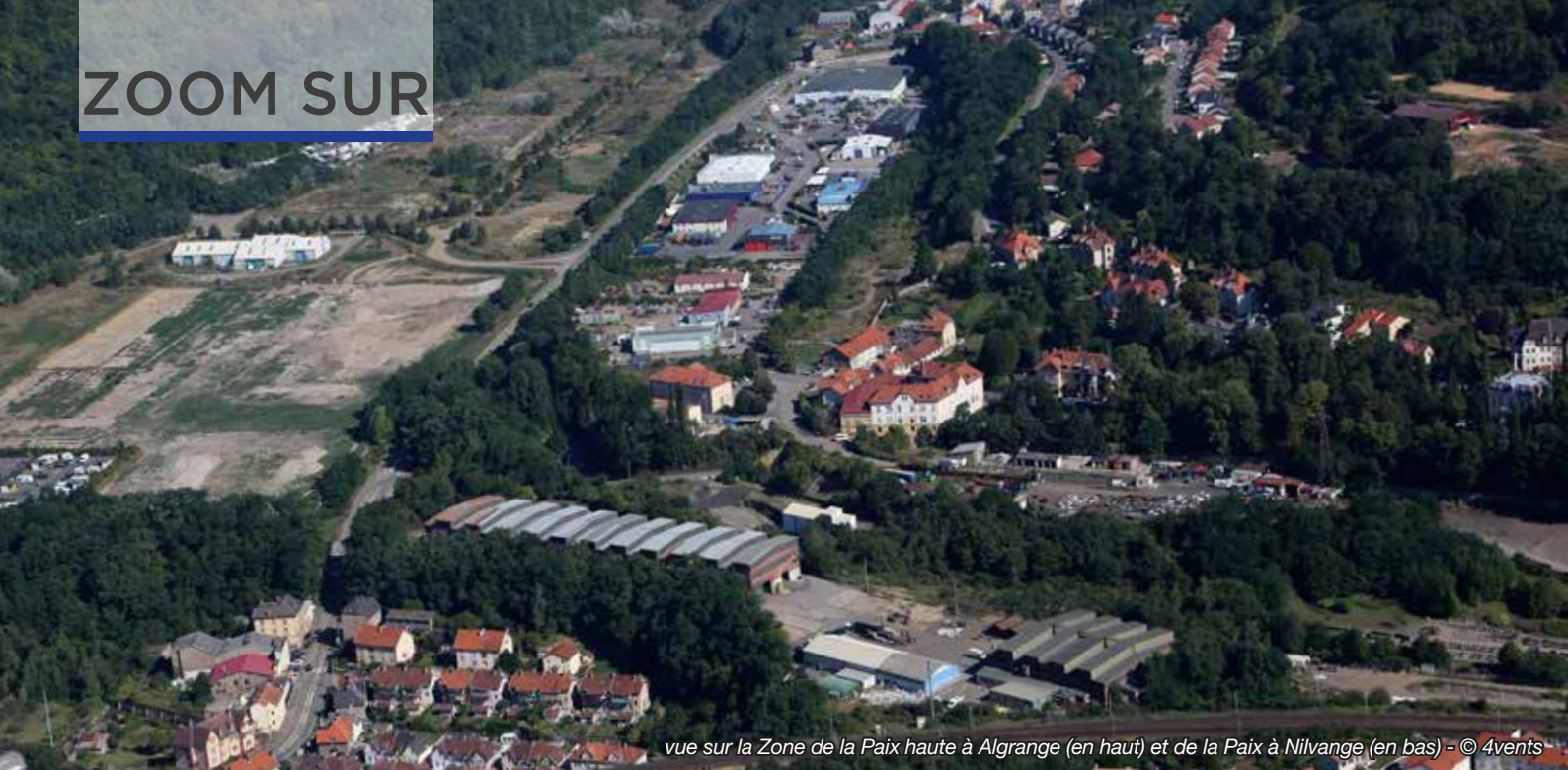
vue sur la Zone de la Paix haute à Algrange (en haut) et de la Paix à Nilvange (en bas)