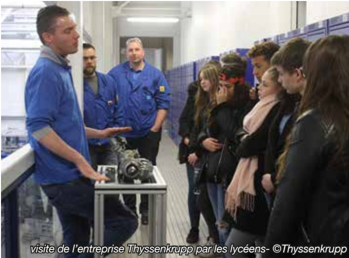
visite de l'entreprise ThyssenKrupp par les lycéens