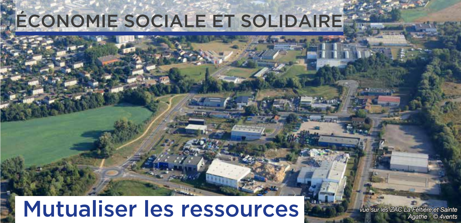
vue sur les ZAC La Feltière et Sainte Agathe