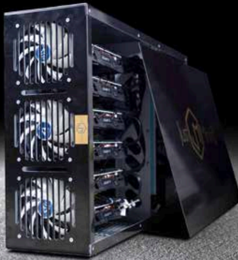
Le boîtier développé par Just Mining permet de gagner de l'argent sur internet en minant des transactions virtuelles