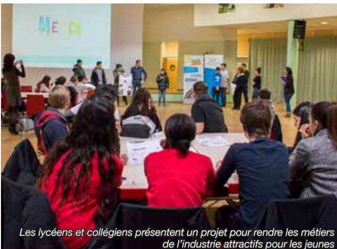
Les lycéens et collégiens présentent un projet pour rendre les métiers de l'industrie attractifs pour les jeunes