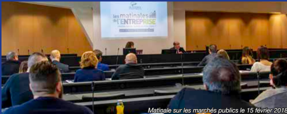
Matinale sur les marchés publics le 15 février 2018