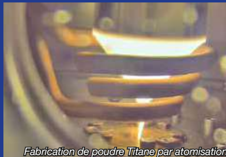
Fabrication de poudre Titane par atomisation

À peine deux ans d'existence et déjà de nouveaux projets ! Le site de MetaFensch à Uckange a été retenu pour l'implantation d'une tour de fabrication de poudres métalliques (notamment l'aluminium) pour de l'impression 3D, en lien avec l'Institut de Recherche Technologique Matériaux, Métallurgie et Procédés (IRT M2P) et Constellium. Cet équipement aboutira sur la création d'un pôle de compétence unique en France et même en Europe. En effet, MetaFensch disposera de deux tours de Recherche et Développement sur les métaux avancés ! Coût de l'investissement 2,5 M€.